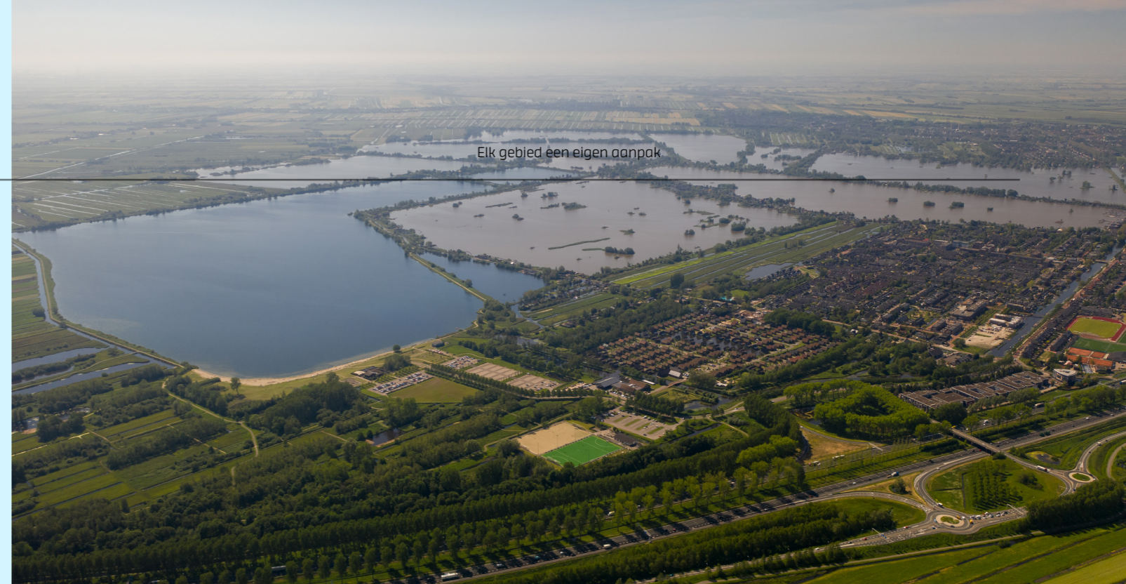
Elk gebied een eigen aanpak